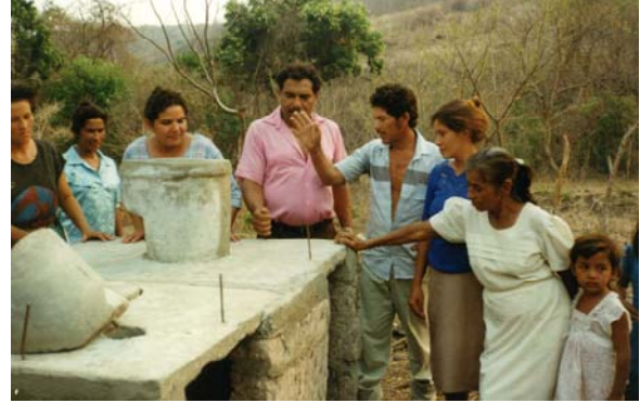
Käymälää esiteltiin naapureillekin

Asenteiden muokkaaminen käymäläprojektille myönteiseksi kesti vuoden. Kylissä yleensä tarpeet tehtiin jonnekkin ympäristöön, ”al aire libre”. Las Tunitasissa ei ollut yhtään käymälää, El Quebrachossa kaksi, El Cascabelissa 4-5, mutta kuoppakäymälät olivat kaivojen lähellä. Varsinkin alussa yliopiston opiskelijat olivat tärkeitä. Kun kyläläiset saatiin innostumaan yhdessä kylässä, he veivät tiedon toisiin kyliin.