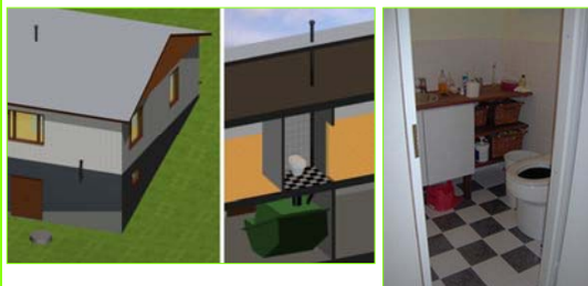
Käymäläseura Huussi ry.