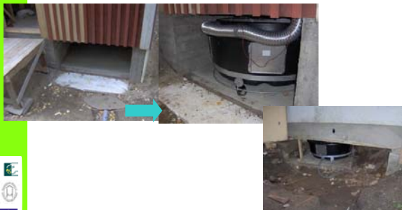
Käymäläseura Huussi ry.