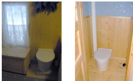
Käymäläseura Huussi ry.