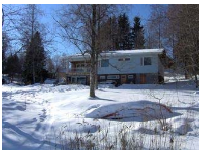
Käymäläseura Huussi ry.