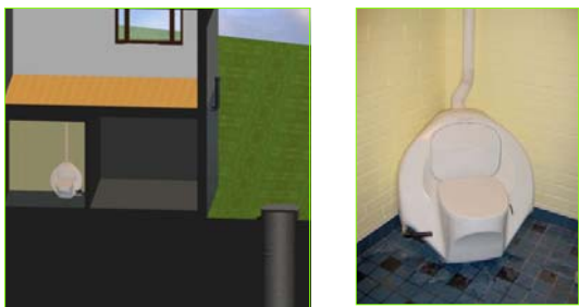
Käymäläseura Huussi ry.