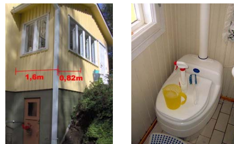
Käymäläseura Huussi ry.